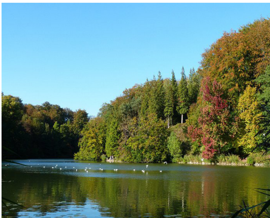
Bild: La Hulpe, hittad på TripAdvisor.com